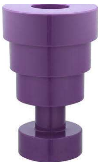
Ettore Sottsass, Calice , 2005. Kartell

“ Faire du design, ce n’est pas donner forme à un produit plus ou moins stupide pour une industrie plus ou moins luxueuse. Pour moi le design est une façon de débattre de la vie.