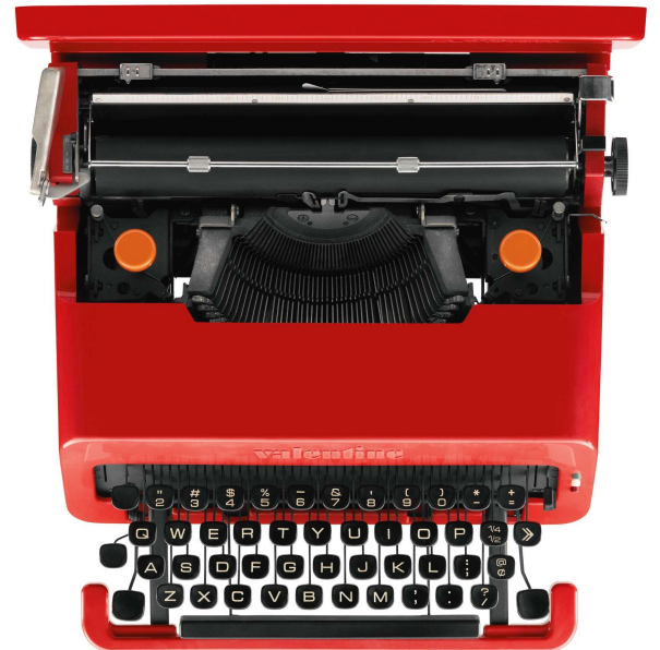
Ettore Sottsass, Valentine , 1969. Olivetti

Brigitte Bardot s'affiche avec sa Valentine à la main dans le film Les femmes de Jean Aurel (1969), David Bowie compose son tube planétaire Let's Dance sur ses touches brillantes et dans Orange Mécanique , Stanley Kubrick en place une dans la chambre de Malcolm MacDowell.