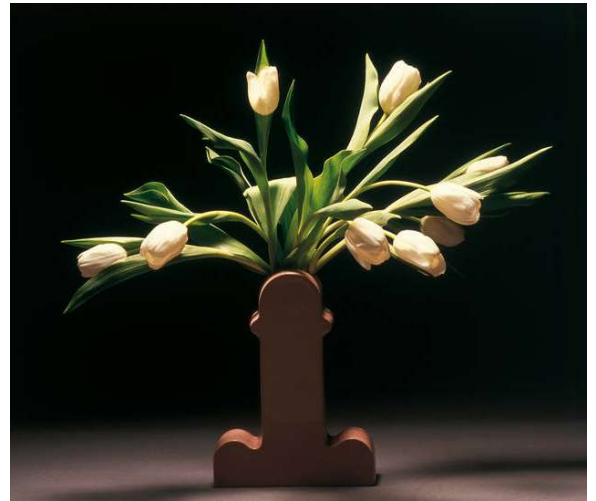
Ettore Sottsass, Shiva , 1973. Bd Barcelona

Avec la série Foto dal Finestrino publiées chaque mois dans le magazine Domus , Sottsass, observateur aiguisé, s'interroge sur le monde qui l'entoure et le remet en question. Cette poésie du monde, palpable dans l'objet deviendra le marqueur d'une pensée revendicatrice et d'une époque.