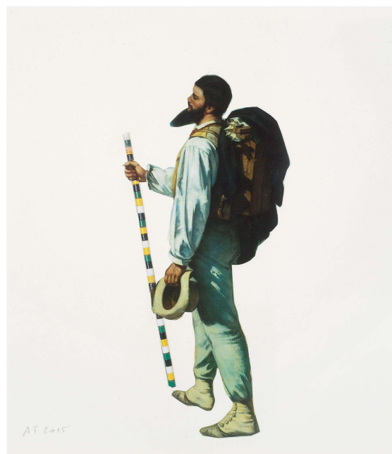
Agnès Thurnauer, Palindrome Courbet / Cadere, 2015

Regarder le promeneur de Courbet en simple visite avec un baton de Cadere dans sa main, imaginer que Artemisia Gentileschi puisse peindre le portrait que Mel Bochner avait peint de Eva Hesse, que la peinture soit surprise en train de peindre la peinture, que le flagrant délit soit celui de la mise en abyme.